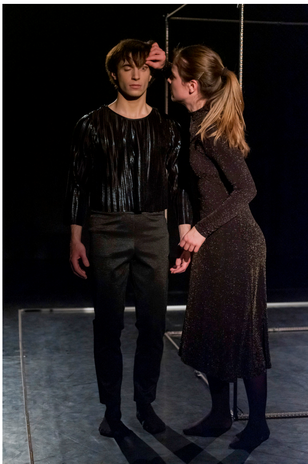
the perfect match KimchiBrot Connection | Koproduktion: studiobühneköln